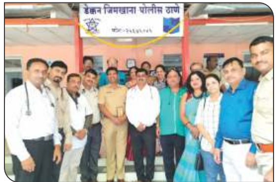
Deccan Gymkhana police station health checkup camp