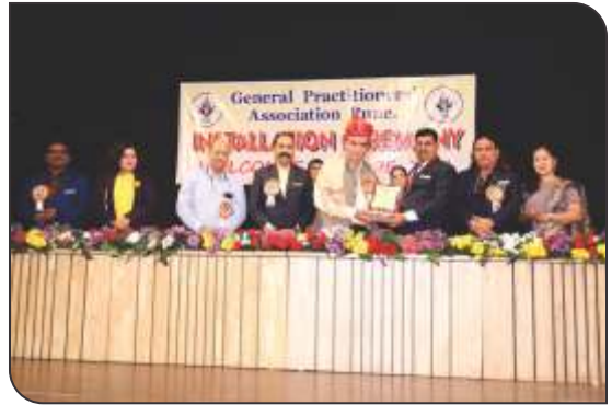
Felicitation of Chief Guest