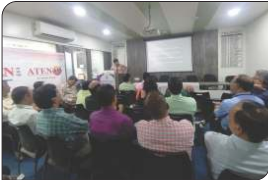
Diabetic update series afternoon lecture - 1