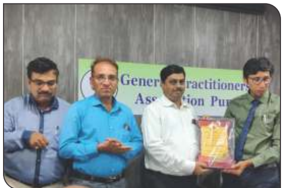
Diabetic update series afternoon lecture - 4