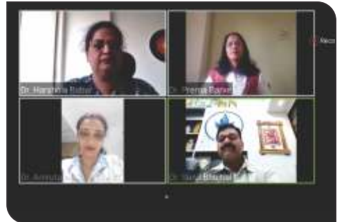
ग्रीष्म ऋतुतील आहार