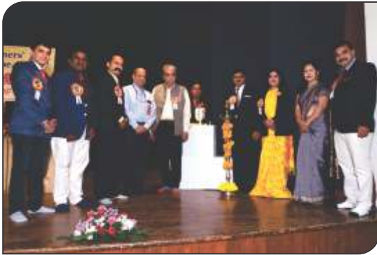
Lamp lighting in installation ceremony