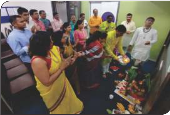
Gudi padhava and Satyanarayan puja in GPA office