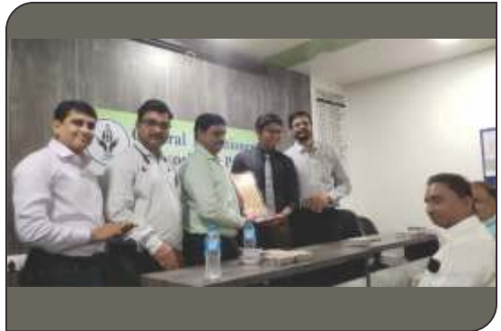
Diabetic update series afternoon lecture - 2