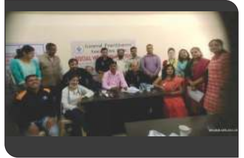
Health check up camp at Arihant College, Bavdhan