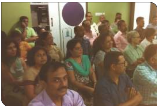
Diabetic update series afternoon lecture - 3