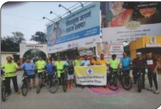
Cycle rally on World Health Day