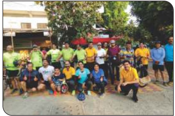
Cycle rally on World Health Day