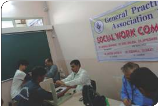
Arihant College Bhavdhan health check up camp