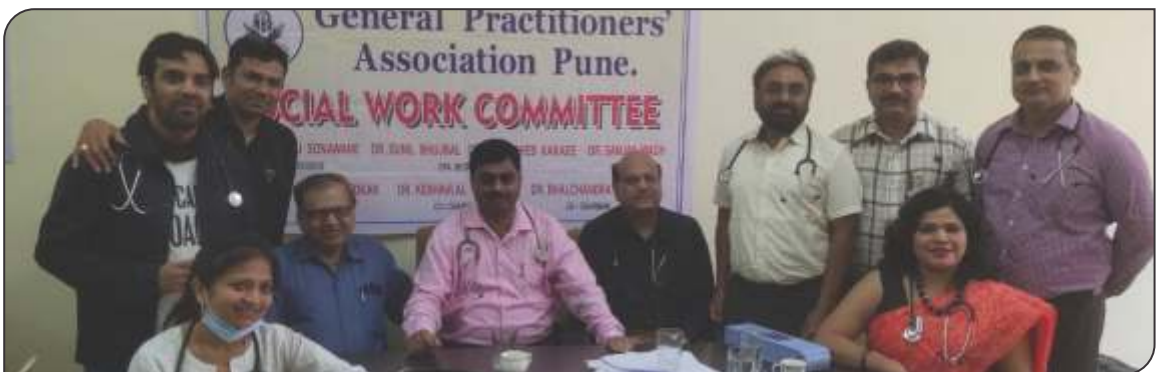
Ariyam college Pune health check up camp.